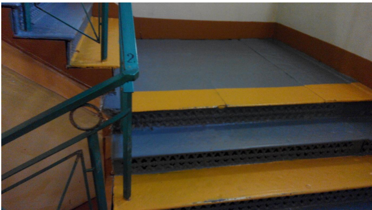
Лестница на второй этаж (с тактильными знаками, окрашенными краями ступеней)