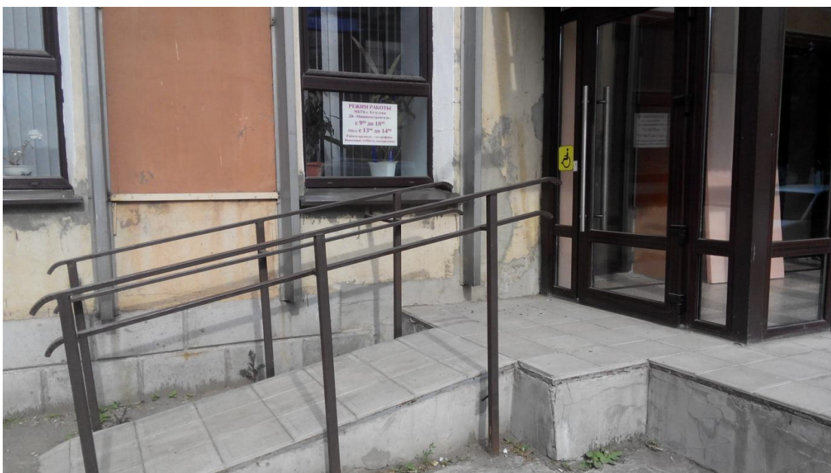
Пандус с противоскользящим покрытием